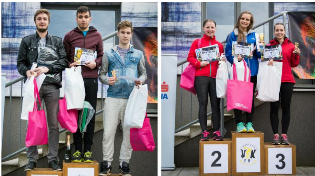
Obrázek 4: Vítězné LS