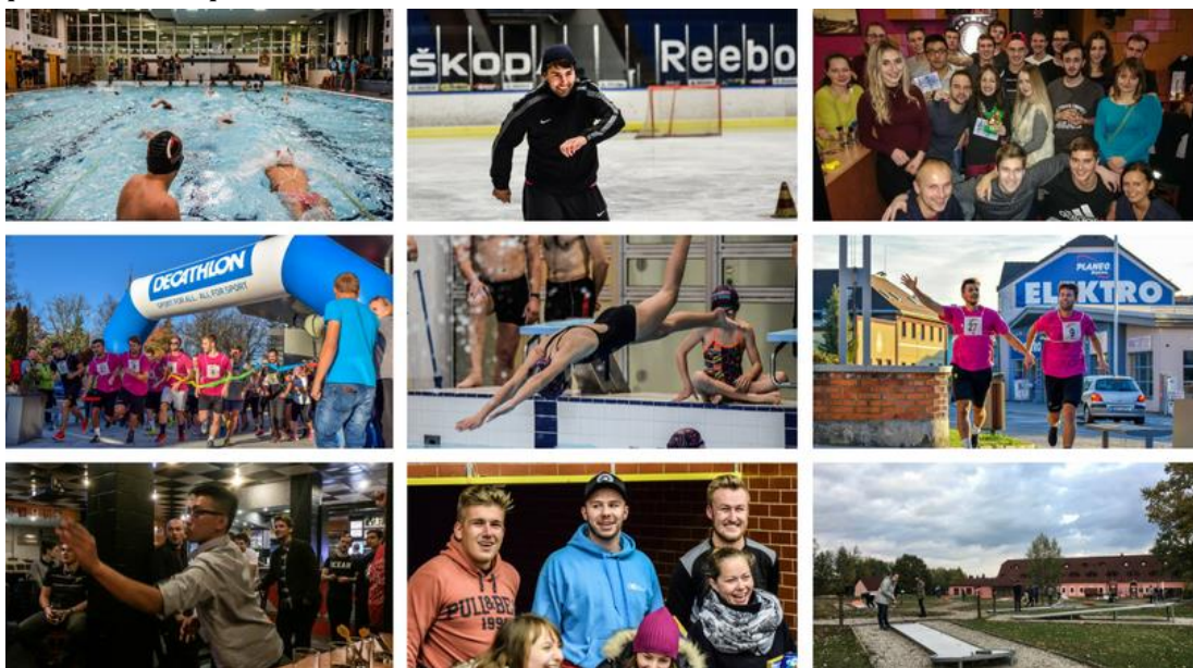
Obrázek 6: Turnaje zimního semestru

Tento semestr jsme započali turnajem v minigolfu, který se uskutečnil v areálu hotelu Frankův dvůr. Dalším závodem byl již zmiňovaný Alfarun. Pro zpestření aktivit jsme si jako třetí turnaj vybrali závod v bruslení, kde se soutěžilo nejen v rychlosti, ale i v obratnosti. Pro odlehčení jsme jako další aktivitu zvolili šipky. Plavecké štafety se uskutečnily před Mikulášem a opět se plavaly 4 rozplavby. Zde bychom rádi vyzdvihli narůstající zájem studentů o tento závod. Bylo opět o jeden studentský tým více. Plaveckých štafet se tedy zúčastnilo celkem 31 studentů. Posledním a rozhodujícím turnajem byl stolní tenis, který měl stejnou strukturu jako v letním semestru, pouze se nám přihlásilo více závodníků.