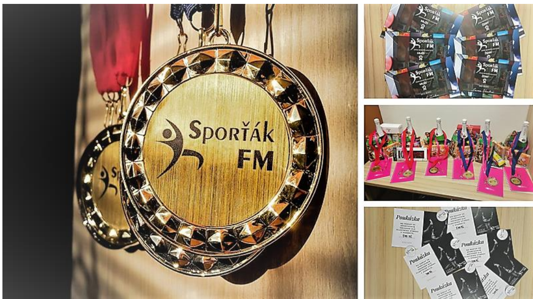
Obrázek 8: Ceny ZS