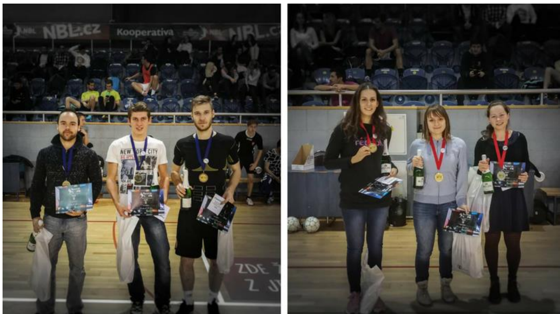
Obrázek 7: Vítězové ZS