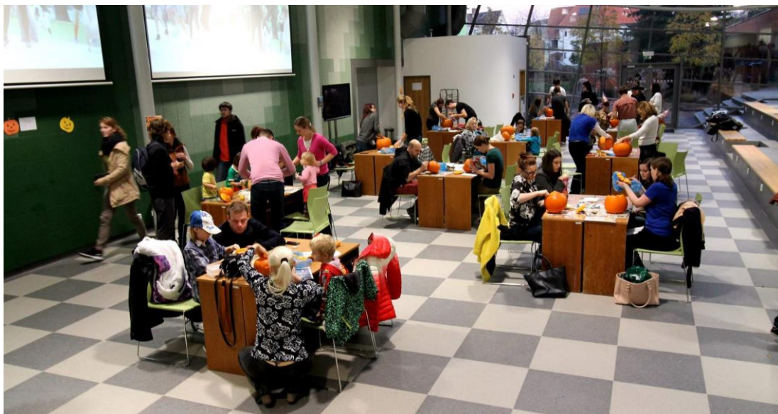
Obrázek 9: Halloween na FM 1. ročník (2016)