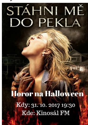
Obrázek 8: Plakát „Horor na Halloween“

V kinosále FM VŠE jsme promítali od 19.30 horor „Stáhni mě do pekla“. Celkem přišlo zhruba 20 studentů. Na promítání jsme měli oficiální práva. Film nám zadarmo zapůjčila filmová distribuční a produkční společnost Bohemia Motion Pictures a. s. Společně jsme se domluvili, že film bude určen pouze pro akademickou obec a bude propagován jen na půdě fakulty.