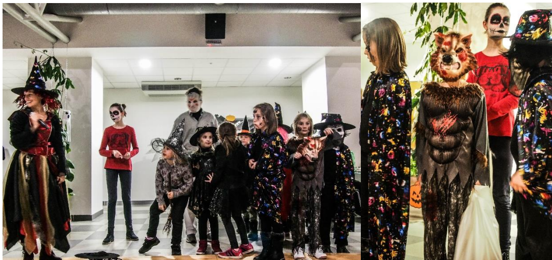
Obrázek 5: Vyhlášení nejlepší masky