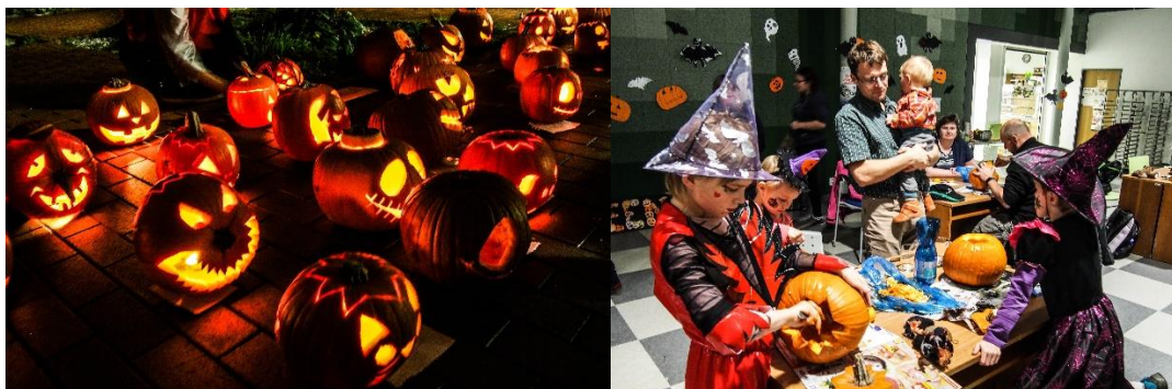
Obrázek 3: Vyřezávání dýní

Při příchodu do dvorany si každý návštěvník mohl vybrat dýni, která mu je nejsympatičtější. Poté obdržel svíčku, potřebné věci na úklid vydlabaných částí dýně a také mohl přispět do kasičky Otevřených OKEN. Aby se účastníci mohli zapojit do soutěže, museli vyřezat dýni do 18:15. V tento čas již všechny dýně svítily na zahradě Fakulty managementu a mohlo začít hlasování. Nejlepší dýni jak v kategorii děti, tak i v kategorii dospělí vybrali návštěvníci této akce.