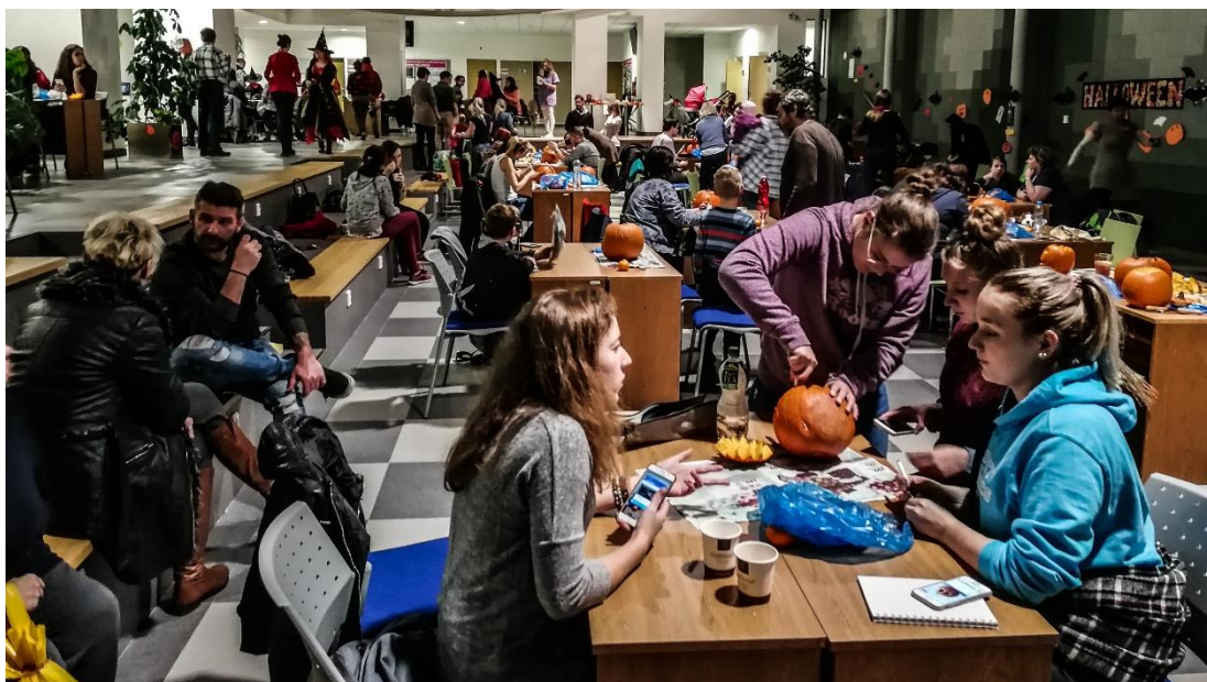
Obrázek 10: Halloween na FM 2. ročník (2017)