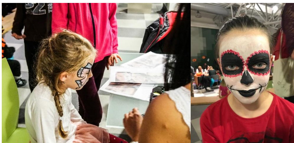
Obrázek 6: Malování na obličej

Letošní novinkou bylo malování na obličej od naší studentky, která se této činnosti věnuje. S velkým překvapením se kromě dětí nechali pomalovat i naši studenti. Celkem toto stanoviště navštívilo zhruba 20 lidí.