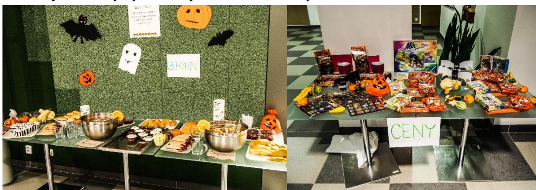
Obrázek 2: Občerstvení a ceny

Letošní novinkou bylo malování na obličeje a skvělé občerstvení od Štěpáté Bohunky. Ta si pro nás připravila muffiny, prsty, želé, punč atd. Celý program byl ukončen před 19:00 a pak následovala úniková hra pro veřejnost a studenty. Od 19:30 bylo navíc připraveno promítání hororu pro celou akademickou obec.