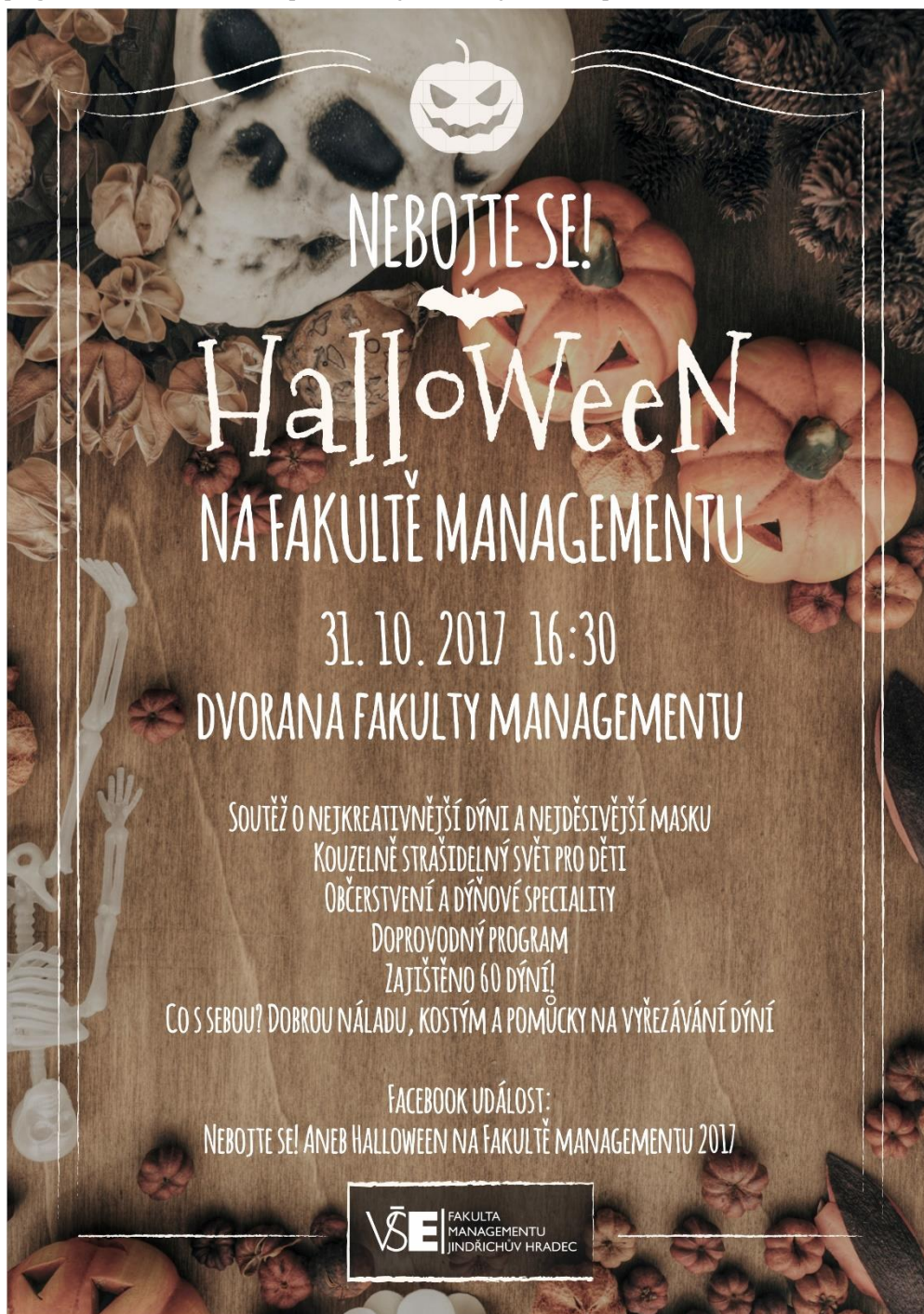
Obrázek 1: Plakát „Halloween na Fakultě managementu“

Halloween na Fakultě managementu se uskutečnil dne 31. 10. 2017. V pořadí se jednalo o již druhý ročník této akce. Hlavní náplní bylo vyřezávání dýní a doplňkové soutěže. Oproti roku 2016 jsme chtěli vylepšit nejen celý program, ale i výzdobu a propagaci této akce. Naším přáním bylo druhý ročník pozvednout zase o úroveň výše.